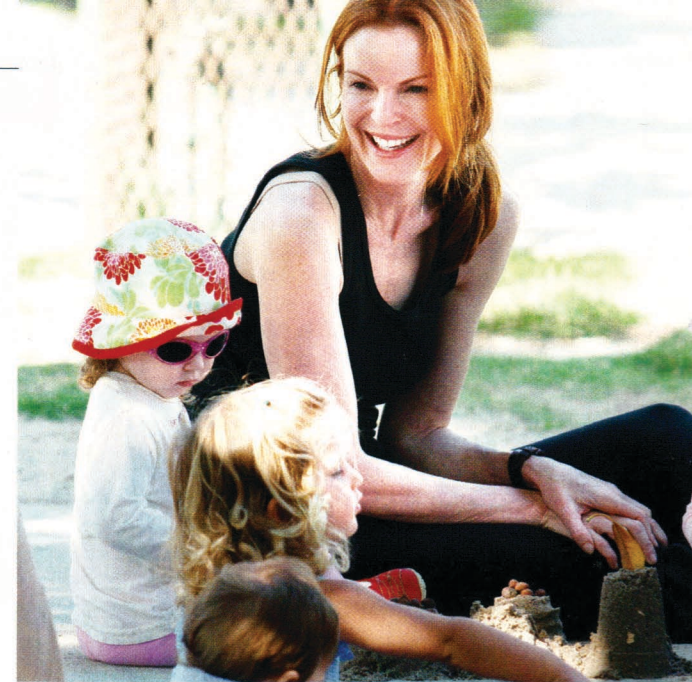
ZWEI AUF EINMAL. „Desperate Housewife“ Marcia Cross im Glück: Die TV-Serien-Aktrice wurde mit 44 erstmals Mutter – von Zwillingen.

Geht's um befruchtete, nicht eingesetzte und letztlich entsorgte Eizellen aus IVF,